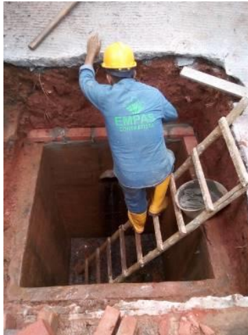
SANTA ANA CALL 13 CRA 3