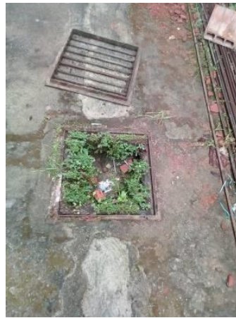
LIMPIEZA GABRIELA MISTRAL SEDE B