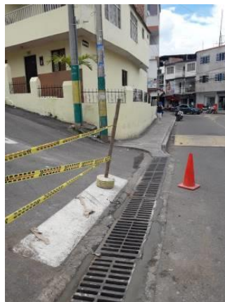
CUMBRE CRA 5E # 28-109