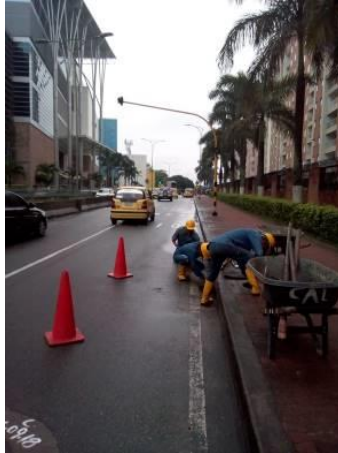
LIMPIEZA C.C. CACIQUE