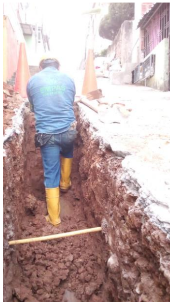
REPOSO CRA 15 CLL 54 Y 55