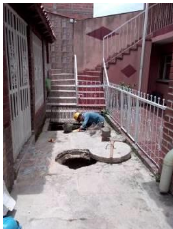
LIMPIEZA VILLA DE LA CUMBRE