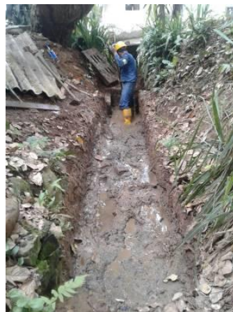
LIMPIEZA LA TRINIDAD