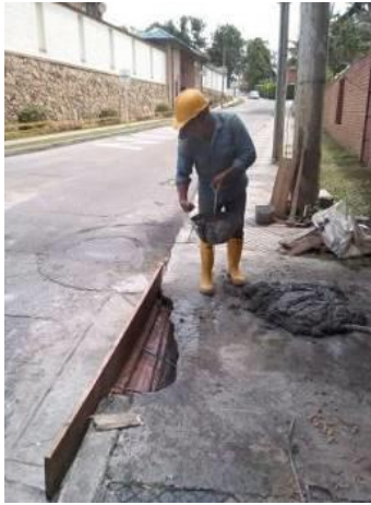
LAGOS CACIQUE CRA 55 # 72-02