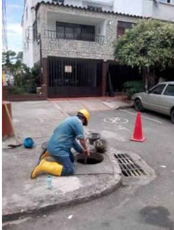
LIMPIEZA LAGOS II