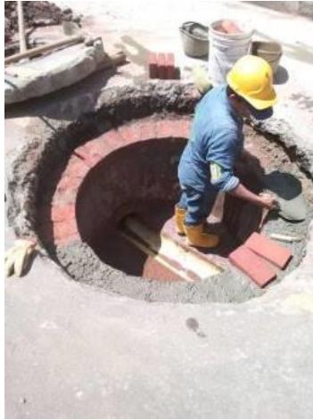
CALDAS CLL 107 # 35-22