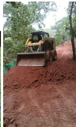
Adecuación vías acceso