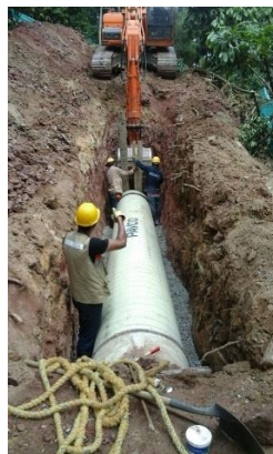
Instalación de tubería