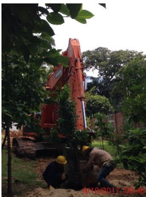
Trasplante especies arbóreas