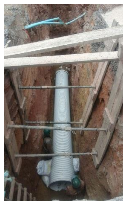
instalación de tubería