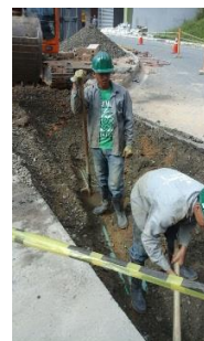
Cruce de la vía