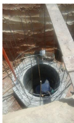
Construcción de pozos