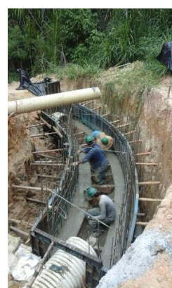
Construcción de curva