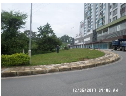
Zona a intervenir sector Abadías