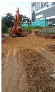
Desmante - descapote y limpieza