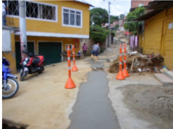
REPOSICION TRAMO RED DE ALCANTARILLADO BARRIO CAMILO TORRES