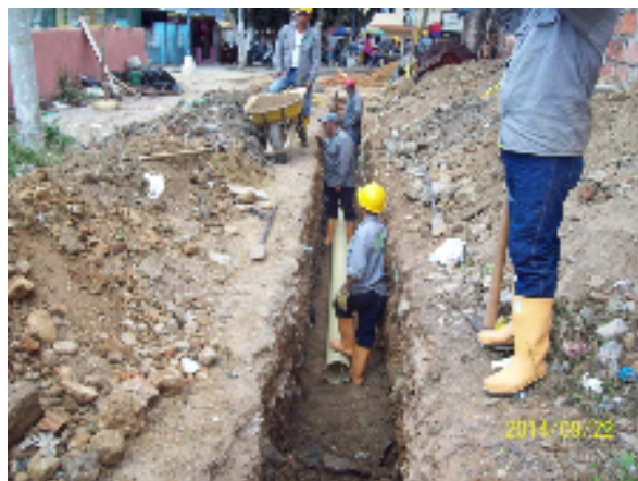
CONSTRUCCION TRAMO RED DE ALCANTARILLADO BARRIO 12 DE OCTUBRE