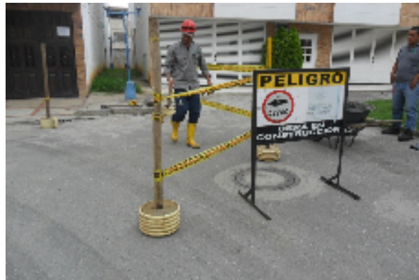
REPOSICION DE CORONA