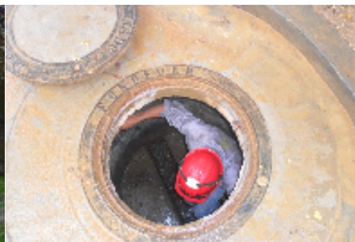
LIMPEZA POZO DE INSPECCION