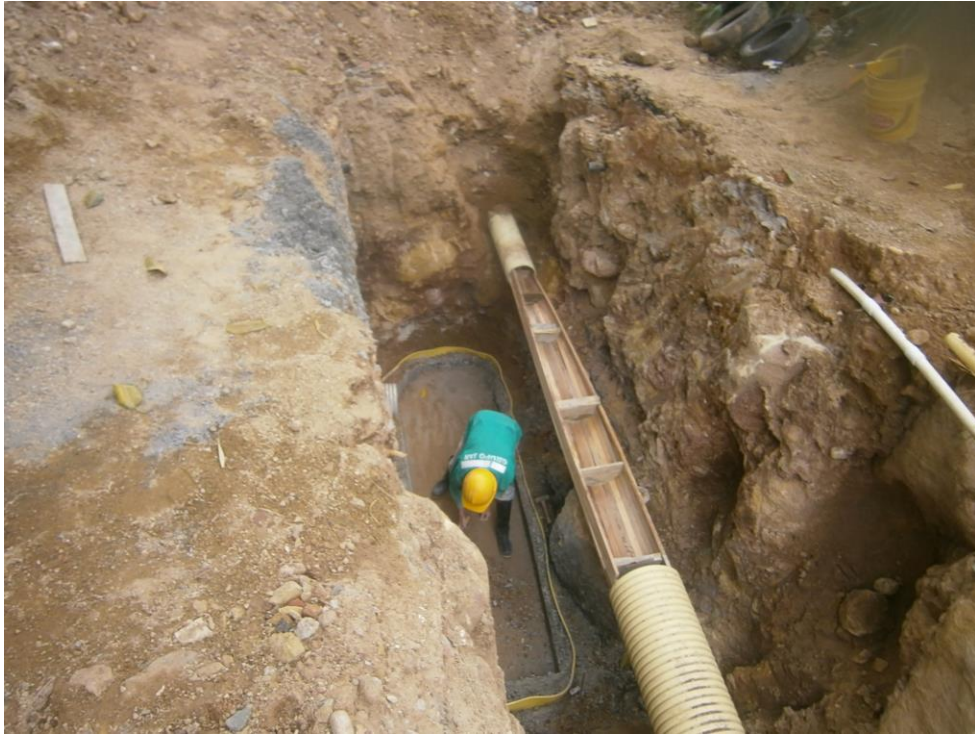
FOTO No. 4 INSTALACION DE TUBERIA EN ESTRUCTURA DE SEPARACION – SEPTIEMBRE 19 DE 2014