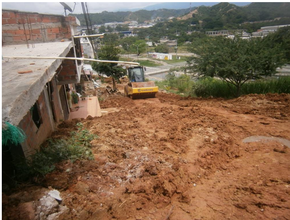
FOTO 6 – UNO DE LOS TRAMOS DEL PROYECTO TERMINADO. SE RESALTA QUE EL BARRIO NO TIENE PAVIMENTO. FECHA - 29 DE SEPTIEMBRE DE 2014